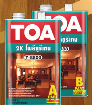
T-8800 T-8888 (ชนิดด้าน)