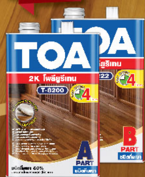
T-8200 T-8222 (ชนิดกึ่งเงา) 50/50