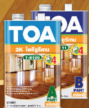
T-8100 T-8111 (ชนิดเงา)