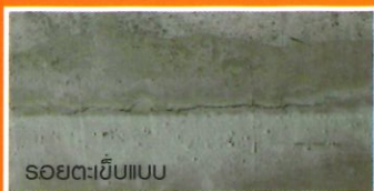
รอยตะขีบบน