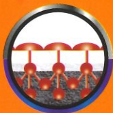
ยึดเกาะดี