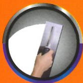
ฉาบเรียบ