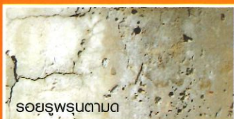
รอยร่วนร่อนตาม