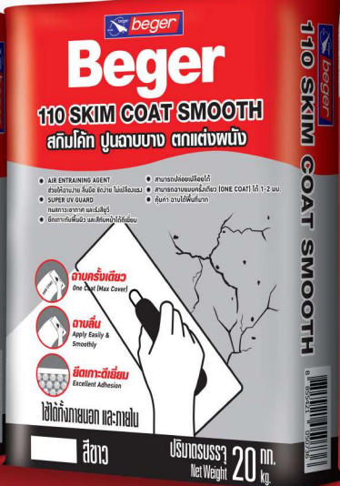
20 กิโลกรัม