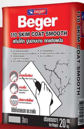
20 กิโลกรัม