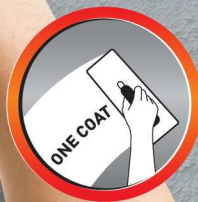
ฉาบครั้งเดียว One Coat (Max Cover)