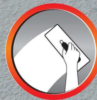
ฉาบลื่น Apply Easily & Smoothly